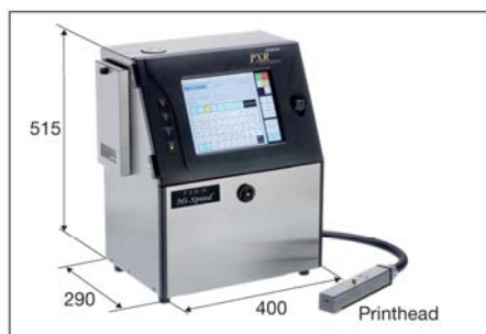
Unità di Controllo