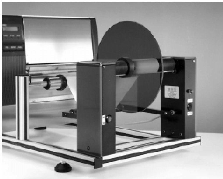
Vista gruppo riavvolgitore